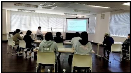
北上サテライト会場 〈ホームケアクリニックえん〉