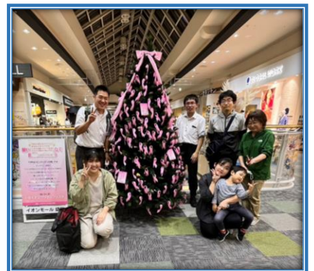
イオンモール盛岡 〈応援スタッフと〉