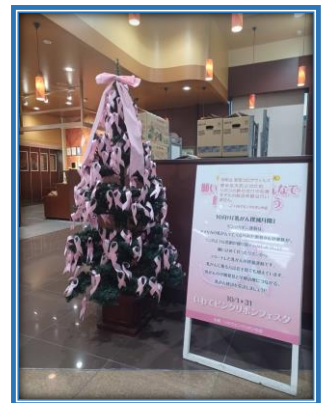
ジョイス三関店 (一関市)