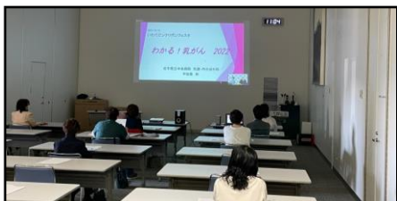
盛岡サテライト会場 〈予防協 Big Waffle〉